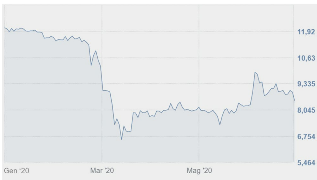
Andamento titolo AdB (01/01/2020-30/06/2020)

Alla data del 30 giugno 2020 si riscontra una quotazione ufficiale pari ad Euro 8,70 per azione, che porta a tale data la capitalizzazione di Borsa del Gruppo AdB a circa 314,3 milioni di Euro.